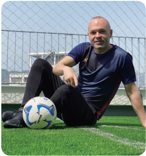
イニエスタ選手 ご自宅バルコニー