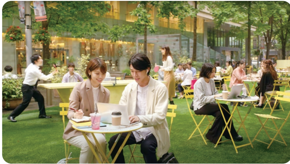
「三菱地所と次にいこう。」 いろんな丸の内篇