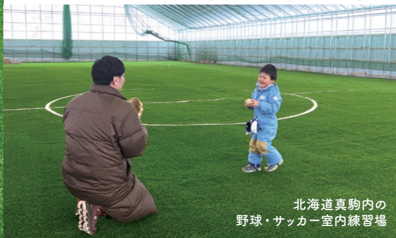
北海道真駒内の 野球・サッカー室内練習場